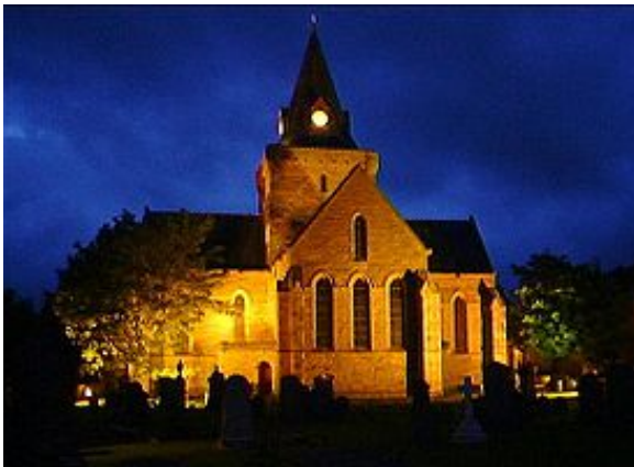
Kathedrale von Dornoch

Auf der Rückfahrt kommen Sie nach Dornoch, das mit ca. 1.200 Einwohnern an der Ostküste Schottlands liegt und die Hauptstadt der Grafschaft Sutherland ist.