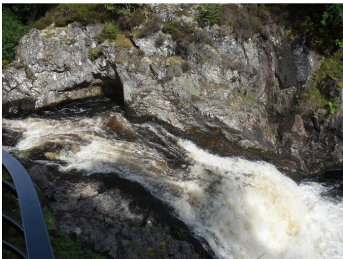
Falls of Shin