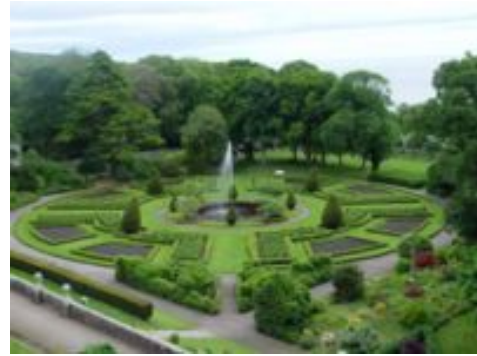
Garten von Dunrobin Castle

Auf der Rückfahrt kommen Sie nach Dornoch, das mit ca. 1.200 Einwohnern an der Ostküste Schottlands liegt und die Hauptstadt der Grafschaft Sutherland ist.