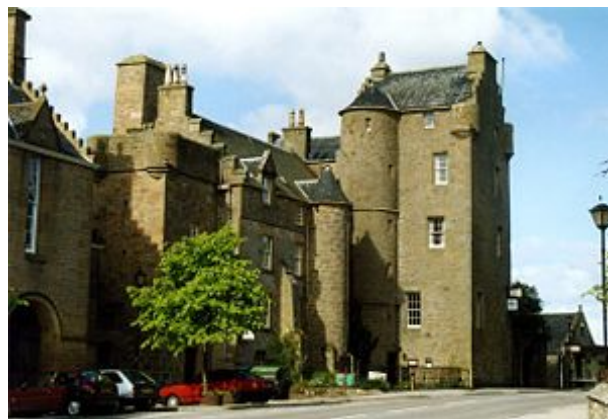
Old Jail von Dornoch

Die Kathedrale des Ortes wurde im 13. Jahrhundert unter der Herrschaft König Alexander II. erbaut. 1570 brannte sie bei einem Feuer aus und wurde im 19. Jahrhundert im viktorianischen Stil wieder aufgebaut. Am 21.12.2000 wurde in dieser Kathedrale Rocco, der älteste Sohn von Madonna getauft. Sie selbst