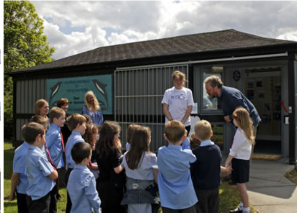
WDCS Dolphin and Seal Centre, North Kessock