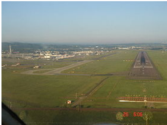
Flughafen Edinburgh Turnhouse

Transfer zum Hotel im Herzen von Edinburgh, der Hauptstadt Schottlands, mit ca. 450.000 Einwohnern. Ein besonders reizvoller Ort mit einem Menue von Veranstaltungen und Festivals.