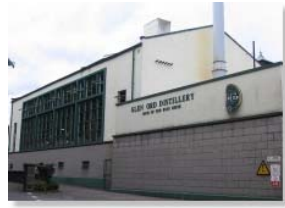
The Glen Ord Distillery

Der Rest des Tages steht Ihnen nach der Rückkehr nach Inverness nochmals zur freien Verfügung.