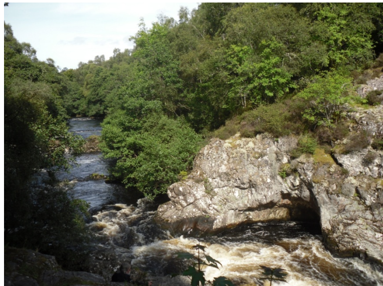
Falls of Shin