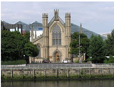
St. Andrews Cathedral

Bis 1778 war der Bau von katholischen Kirchen verboten. Die Grundsteinlegung erfolgte im Juni 1814, die Fertigstellung war am 22.12.1916