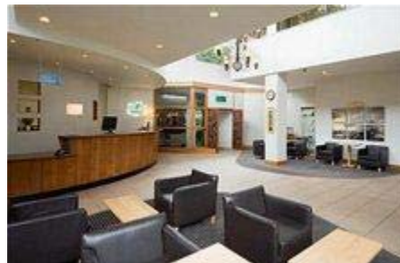
Holiday Inn West