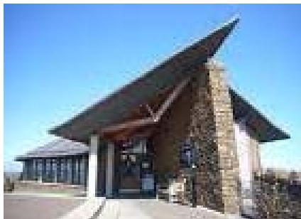
Scottish Seabird Centre

Alternativ steht eine Besichtigung der West Lothians mit dem Königspalast Linlithgow und der modernen Forth Bridge auf dem Programm