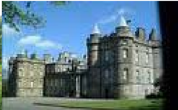
Holyrood Palace 1

Das Schloss ging in die Geschichte durch seine zeitweilige Bewohnerin Maria Stuart ein. Der Gebäudekomplex war auch ein Ort dramatischer Ereignisse, wozu beispielsweise die Ermordung von David Rizzo, dem italienischen Sekretär von Maria Stuart, am 9. März 1566 gehörte.