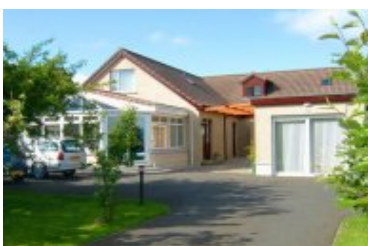
Lav'rockha Guest House

Nach der Überfahrt, vorbei am Old Man of Hoy, erreichen Sie Stromness. Entdecken Sie die Vielfalt der Insel während einer halbtägigen Rundfahrt, bevor Sie Ihr Hotel in Kirkwall beziehen.