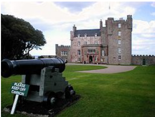
Castle of Mey

Danach fahren Sie an der Küste entlang bis nach Inverness