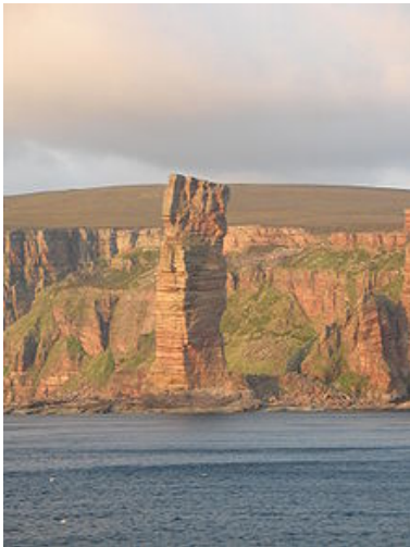
Old Man of Hoy

beiden Leuchttürme auf Graemsay tauchen auf und kurz darauf läuft die Fähre in Stromness ein.