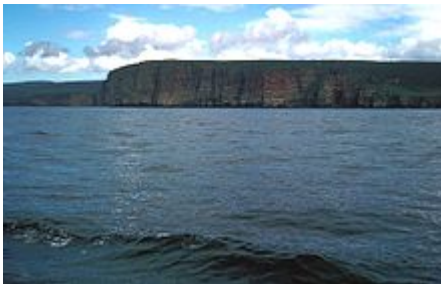
Orkney von der See