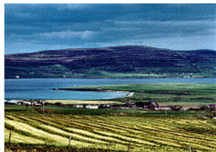
Orkneys aus der Luft