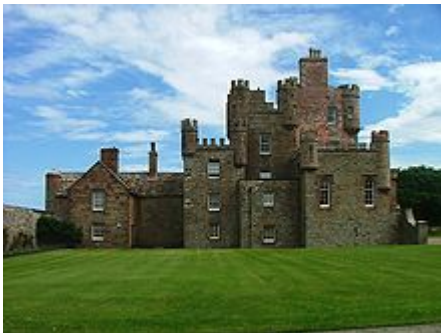
Castle of Mey

Am späten Vormittag verlassen Sie die Orkneys wieder mit der Fähre. Nach der Ankunft in Scrabster geht die Fahrt an der Nordküste zum Castle of Mey, dem ehemaligen Sommerdomizil von Queen Mum.