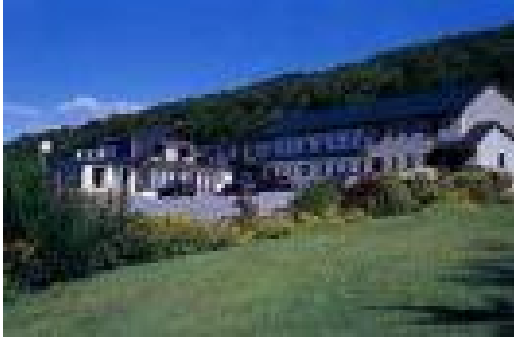
Clan MacDuff Hotel